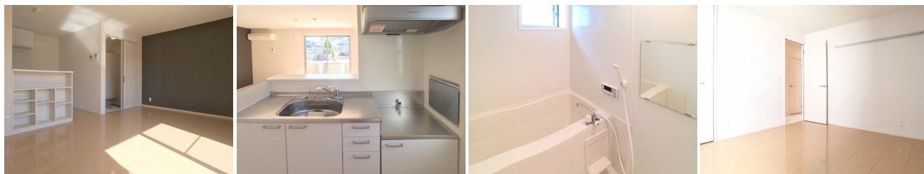
LDK キッチン 浴室 洋室