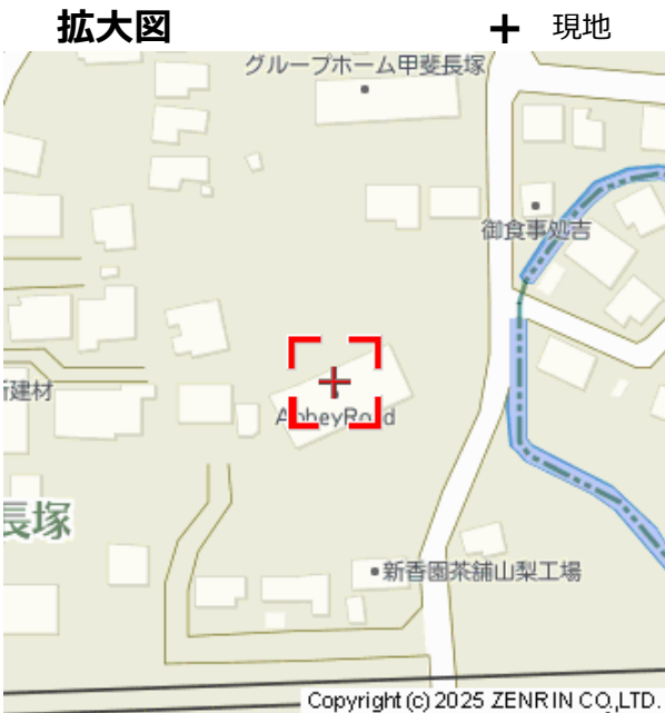
拡大図 (Zoomed map)